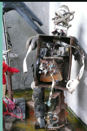
Conception : Université Paris 13 - Impression : reprographie centrale - mai 2015

Amphithéâtre Hannah Arendt Université Paris 13, Campus de Bobigny